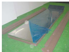
ステンレスの板×1 ステンレス板の 補助枠×2