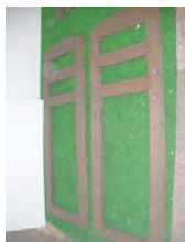
中央の側面枠×2 中央の足場×1