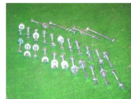
115ミリボルト×4 65ミリボルト×22 * 仮組みされ ボルト数が違う 場合がございます