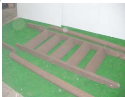
階段×1 階段の手すり×2